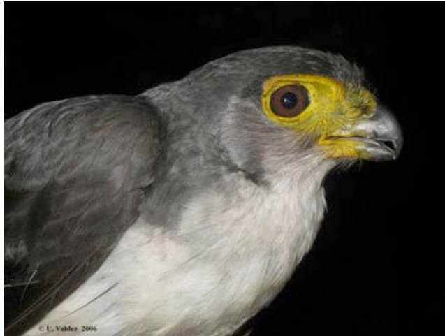
Un halcón de bosque macho subadulto, Micrastur mirandollei , capturado y equipado con radiotransmisor en Los Amigos en octubre de 2006.

Estudio de la distribución y la abundancia de Euterpe precatoria en fotos aéreas e inventarios de campo en la Concesión para Conservación Río Los Amigos Emperatriz Salcedo (Perú) Universidad Nacional San Antonio Abad del Cusco - Puerto Maldonado (Perú)