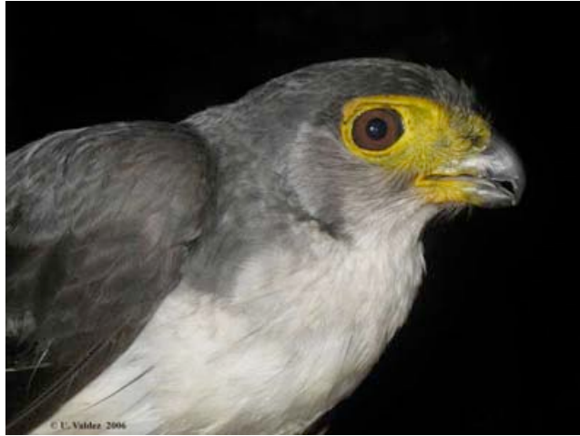
A subadult male forest-falcon, Micrastur mirandollei , captured and radio-fitted at Los Amigos in October 2006.

Now on to the falcons. In late 2006 Ursula wrote: "Following up on last field season, my team and I have continued surveying forest-falcons around CICRA. We have also re-started the radiotracking of recently captured forest-falcons, as well as those captured last year. In mid-October we captured the first individual of one of the least-known forest-falcon species: a subadult male Micrastur mirandollei (see photo). So far we have fitted radio transmitters to 14 forest-falcons in the area and we continue to monitor their movements." In October Ursula took off a few days from field work to attend the North American Ornithological Congress in Mexico, where she received the Alexander Skutch Award and ran into two other ornithological alumni of Los Amigos (see photo).